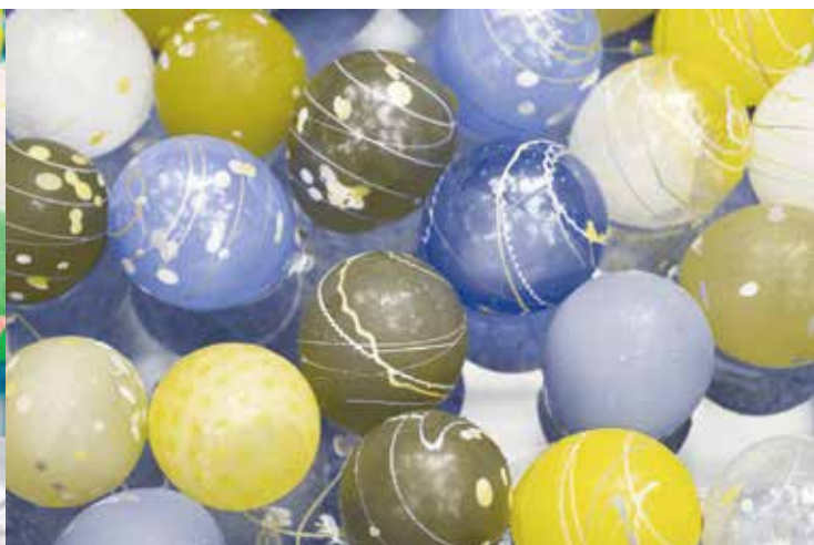
色覚障がい者(P型)の見え方をシミュレーションした画像